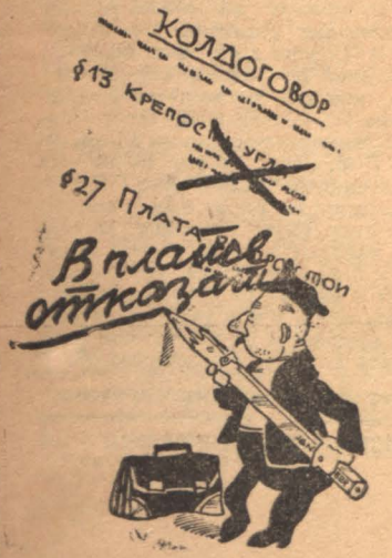
КОЛДОГОВОР $13 КРЕПОС... Власть отказалась $27 ПЛАТ...