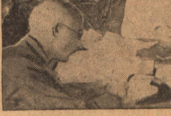
Делегация проверяет выполнение обязательств