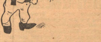
Десятник Лебедев заставляет рабочих таскать лес