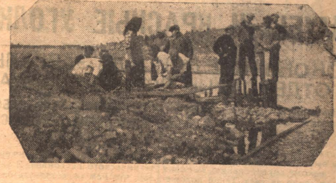
Рабочие водокачки хмизавода на воскресные