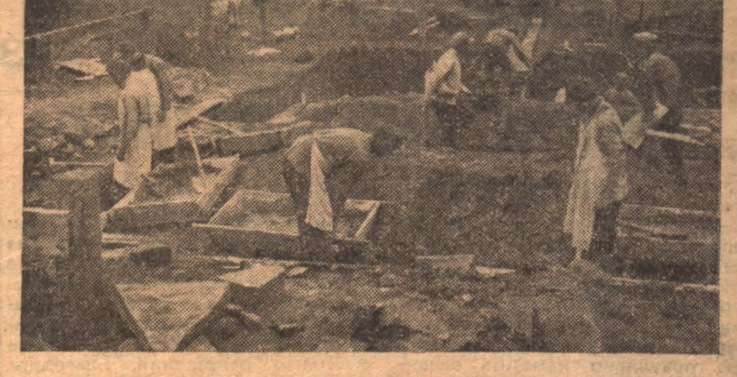
На бойне начались работы по кладке фундамента