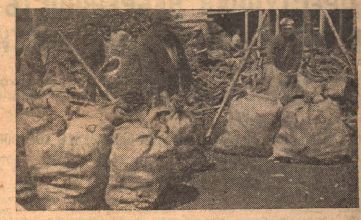
НД СНИМКЕ: Сотрудники Сибрайгосторга на воскреснике в день индустриализации 6 августа