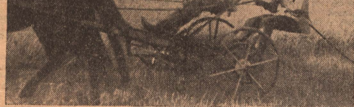
НА СНИМКЕ: жатва озимого хлеба в Топкинском районе