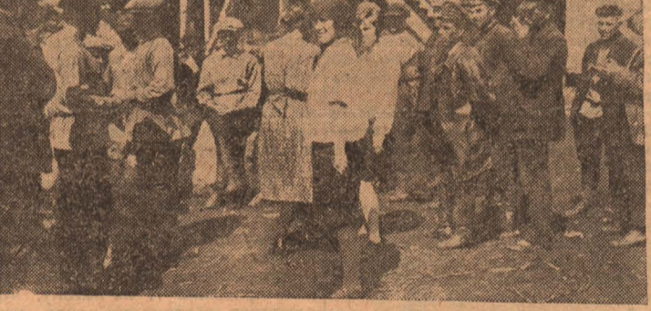
НА СНИМКЕ: Сибторговцы на митинге после воскресника 6 августа