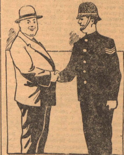
Английский полисмен присутствует Цергибеля