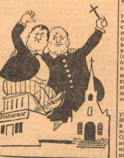
— Что вы отделите, когда мы кровно связаны?

БЕРЛИН. Рейхстагом отклонено предложение коммунистов об окончательном отделении церкви от государства.