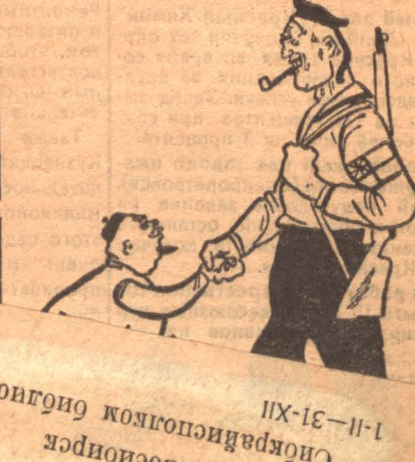
Их-12-11-1 Сибкрайполитбюро Новосибирск Кто нан, а помещики в вои...

Английский десант выселился в Кантоне, главная цель десанта — предотвратить выступления рабочих и помочь гуансийцам (помещичья группировка). (Из телеграмм).