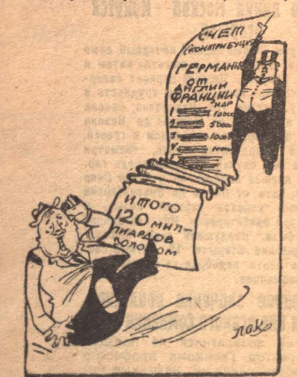
ШТРЕЗЕМАН: — Вот тебе, бабушн, и юрьев день...

На репарационной конференции в Париже союзники выработали окончательный счет об уплате Германией контрибуции... в 120 миллиардов марок золотом. (Из газет).