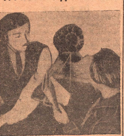
Поезда с туристами облучиваются радио