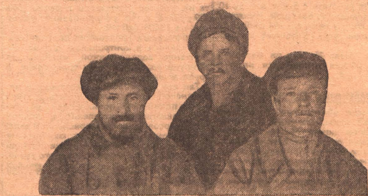
Ударная бригада по социалистическому соревнованию сельско-хозяйственной артели на ст. Топки

— Будете лезть, шурфом, отвечает администрация. Но шурфом лезть, тем более с инструментами, совершенно нельзя: очень много будет несчастных случаев. Зубок.