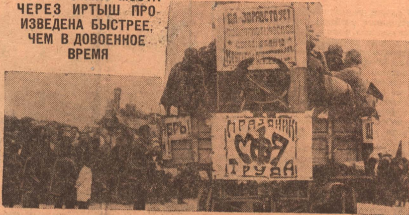
На трибуне плакат о социалистическом соревновании между Турксибом и Днепростроем

ПОСТРОЙКА МОСТА ЧЕРЕЗ ИРТЫШ ПРОИЗВЕДЕНА БЫСТРЕЕ, ЧЕМ В ДОВОЕННОЕ ВРЕМЯ