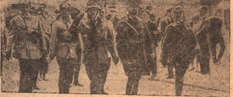
Демонстрация австрийских фашистов (Хеймвер)

Социалдемократы на с'езде проф организаций в Гельсингфорсе (Финляндия) отказались от занятия выборных должностей, поэтому председателем и секретарем организации избраны левые. Социалдемократы мотивируют свой отказ от выставления кандидатур тем, что проф организации приобрели твердую выраженную коммунистическую окраску.