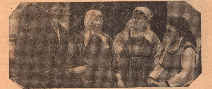
Батраки и крестьянки, делегатки XIV всероссийского съезда советов

45. В случае несогласия проверочных с изменением его постановления проверочным имеет право обжаловать это изменение своего постановления в вышестоящую КК