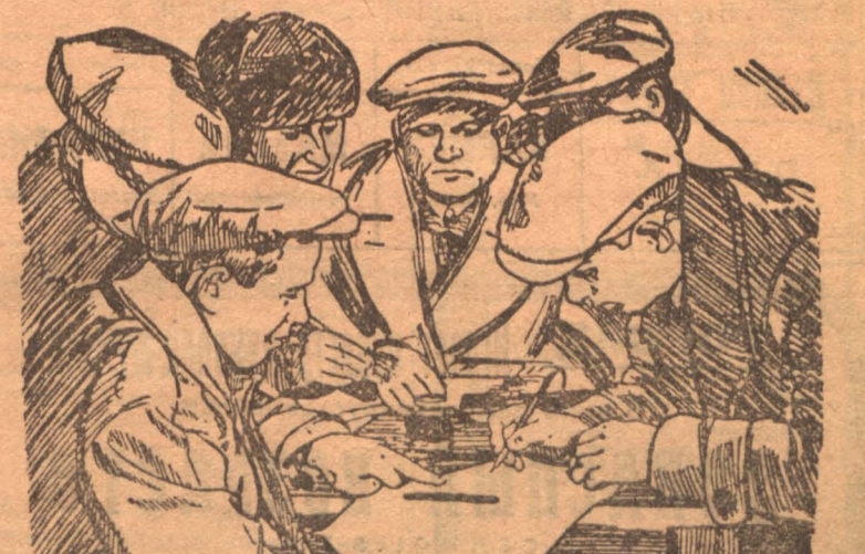
Рабкоровы подписывают овой договор

День печати будет ознаменован сбором во всех соседних деревнях пожертвований на постройку танка им. Ульяновой и самолета «Рабселькор».