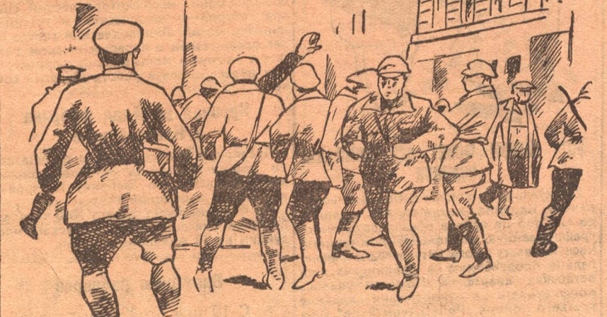
Столкновение между полицией и красными фронтовиками в Берлине