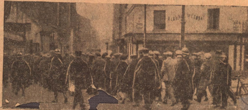
Арест демонстрации перед зданием профсоюза