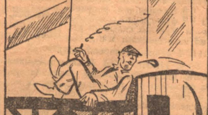
—лодыри на производстве