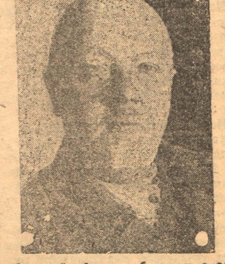
избранный общим собранием академиков на пост вице-президента Академии Наук СССР