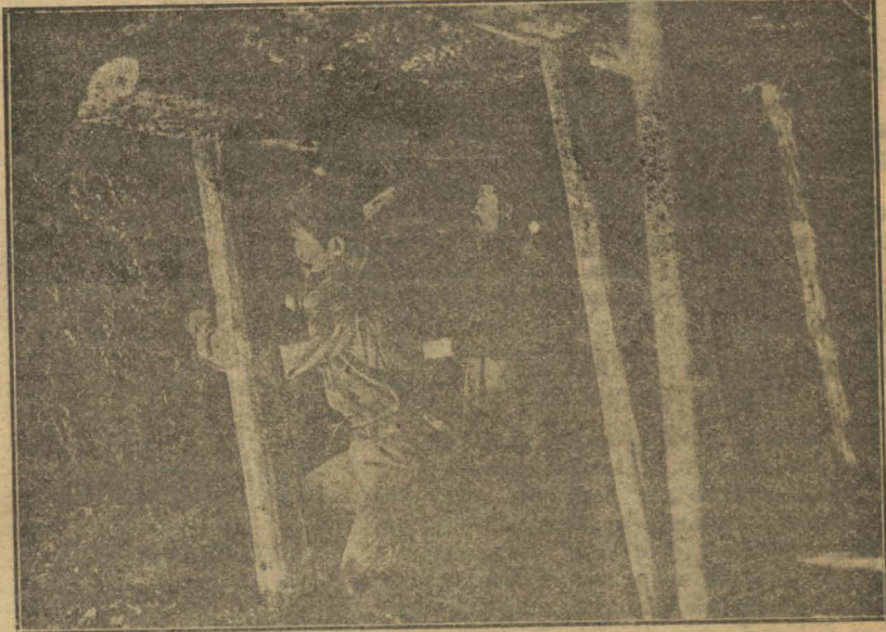
В забое Емельяновской шахты.

Такая программа на капитальные горные работы будет затронуто 1.444 руб. без врубловых машин и конвейеров.