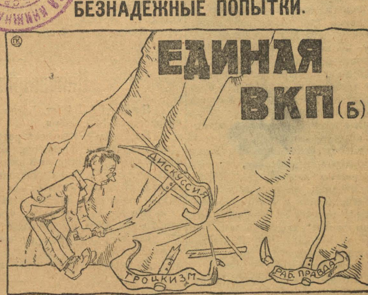
Сналы не расколоть.

Много недочетов с выдвиганием, часто рабочие отказы-