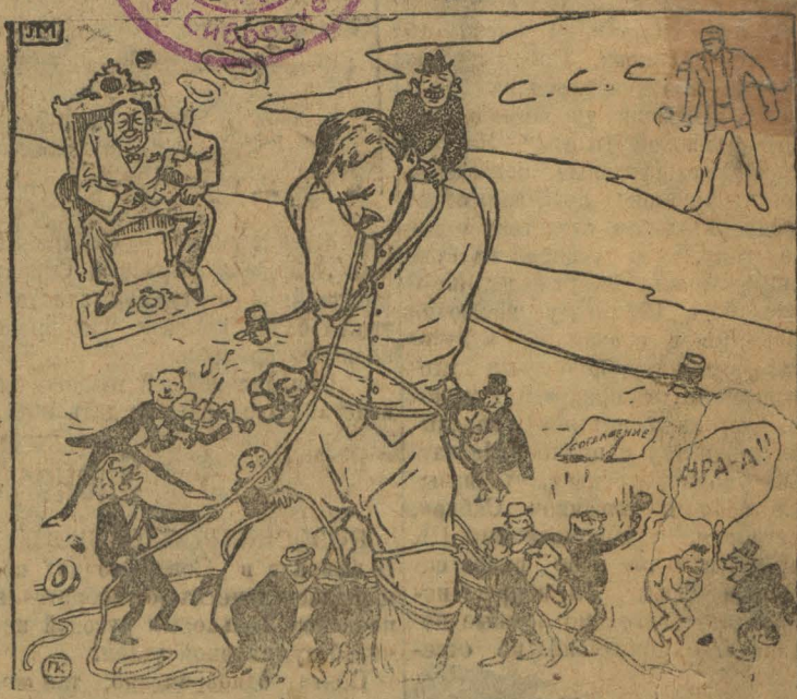
Генсовет стремится „укрепить положение“ горняков