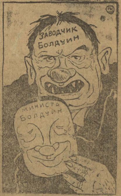
...а не то мы вас, чорт подери, силой заставим!!!