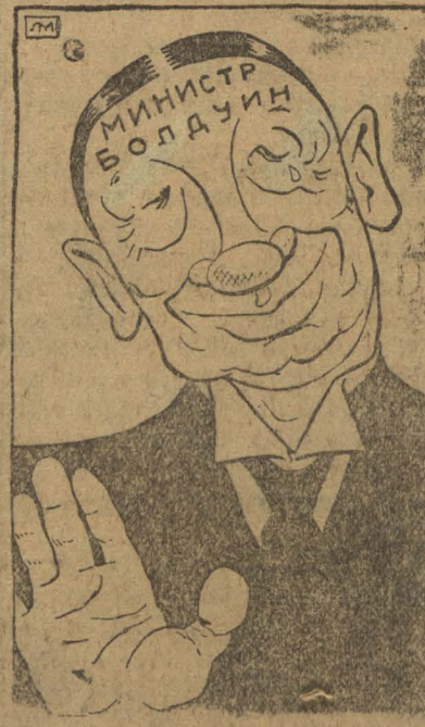
Друзья мои, горнорабочие! Прошу вас согласиться на 8 часовой день...