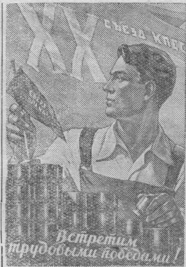
Плакат работы художника В. Коренько (Государственное издательство изобразительного искусства).

Речники назвали новую линию «трассой дружбы».