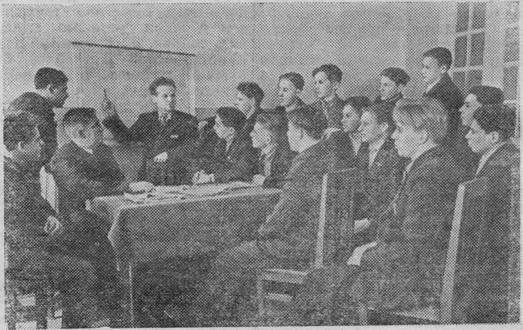
Барнаул. Первая группа московских комсомольцев, прибывших в Алтайский край на освоение целинных и залежных земель, приступила к учебе.

Все силы и средства на выполнение решений Пленума ЦК КПСС! Освоением новых земель добьемся обилия продуктов сельского хозяйства в нашей стране!