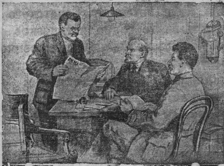
В.И. Ленин, И.В. Сталин и В.М. Молотов в редакции «Правды»

Тридцать семь лет назад—5 мая 1912 года—по инициативе Ленина и Сталина вышел первый номер ежедневной рабочей газеты «Правда».