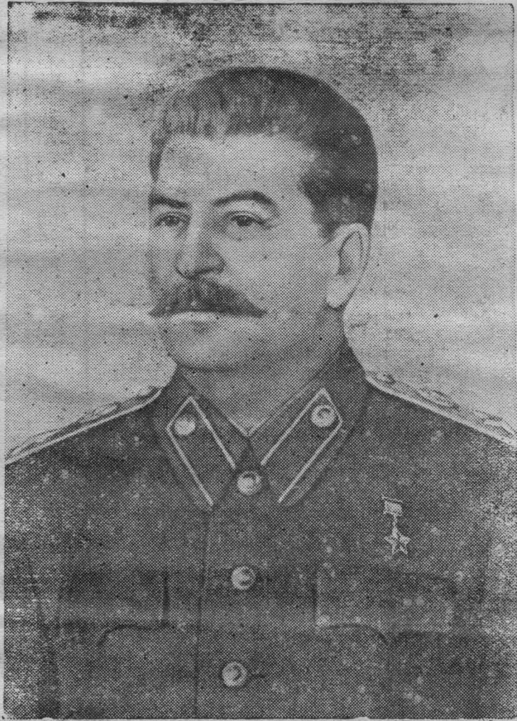
Иосиф Виссарионович Сталин.