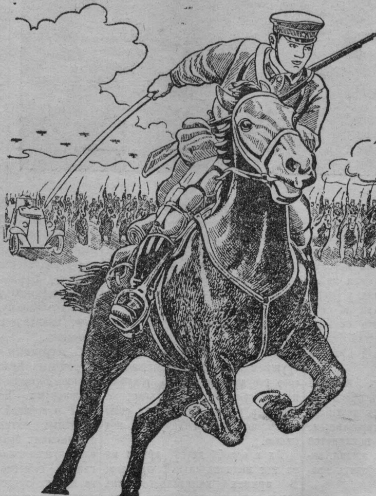
НА СНИМКЕ: Плакат художника ЗЕЛИХМАН, выпущенный Воениздатом.