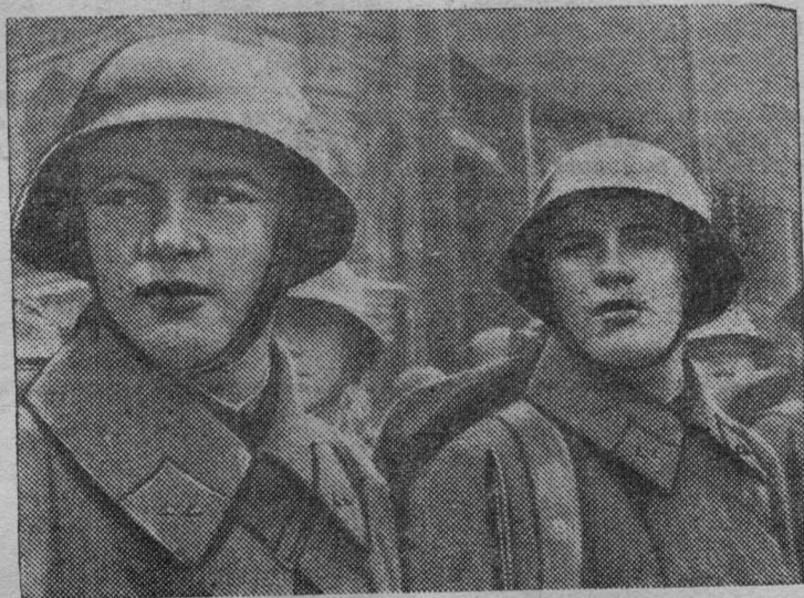
Бойцы Н-ской части на Красной площади перед парадом.

с достоинством и честью, не щадя своей крови и самой жизни для достижения полных побед над врагами».