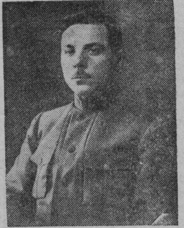
НА СНИМКЕ: Тов. К. Е. Ворошилов, в 1918 г. в Царицыне, в период командования X армией.

Рабоче-Крестьянская Красная Армия и Военно-Морской Флот — мощный оплот мирного труда и великих завоеваний граждан СССР. И в грозный час, когда капиталистические хищники попытаются перешагнуть священные рубежи нашей родины, вооруженные силы СССР, опираясь на поддержку всего многомиллионного народа, обрушатся на врага и сотрут его с лица земли.