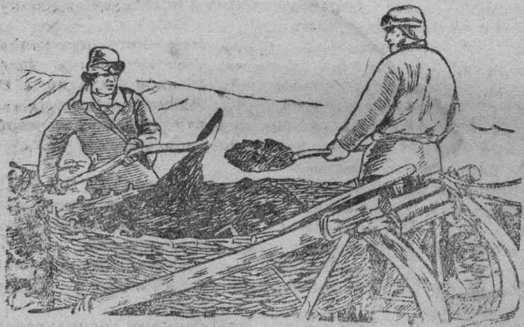
На снимке: Вывозка перегноя на поля колхоза „Красный остров“.

Звеньевод стахановец Б. К. Кривонос, колхоз „Красный остров“ усиленно готовится к получению высокого урожая, он уже собрал и вывез на свой участок перегноя — 415 возов, золы 155 центнеров, фекалий 25 центнеров и много других местных удобрений. Провел задержание снега, задержав снег на всем участке глубиной более 1-го метра.