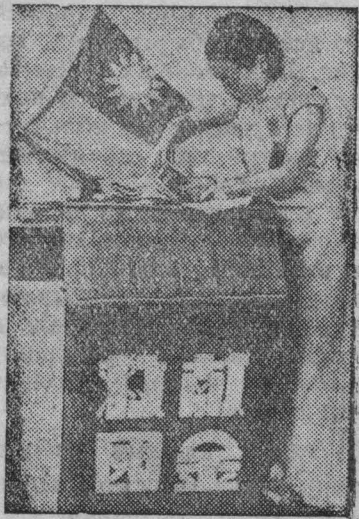
На снимке: Подсчет жертв, собранных для национальной обороны.

Китайский народ объединился против японских милитаристов и всеми средствами помогает своей армии в борьбе против врага.