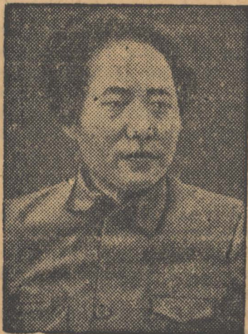
Мао-Цзе-Дун руководитель китайской компартии.

Партизаны получили сведения, что из города Тонтоу в Суаянь вышло восемь японских грузовиков с продовольствием и бензином. Как захватить этот транспорт? Если напасть днем—можно потерпеть поражение или добиться успеха ценой больших потерь. Тогда партизаны, преодолевшись женщинами, вышли на поле в районе дороги, делая вид, что копаются в земле. Как только грузовики и сопровождавшая их охрана порывались с «женщинами», переодетые партизаны бросились на перерез и открыли по японцам ружейный и пулеметный огонь. Шесть машин были уничтожены вместе с японскими солдатами и только двум удалось скрыться.