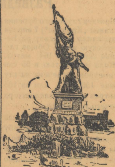
Памятник в Омске на братской могиле борцам за власть Советов, погибшим в дни колчаковщины.