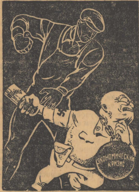
Долой фашистских поджигателей войны!

Таким образом, вторая важнейшая особенность нового кризиса заключается в том, что он „разыгрался не в мирное время, а в период уже начавшейся вто-