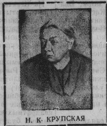
Н. К. КРУПСКАЯ

Советский народ понес тяжелую утрату. Оборвалась прекрасная жизнь близкого друга и верного помощника великого вождя и гения пролетарской революции В. И. Ленина — Надежды Константиновны Крупской.