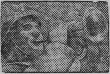
Горнист республиканской армии.

молет завертелся и листом начал падать вниз.