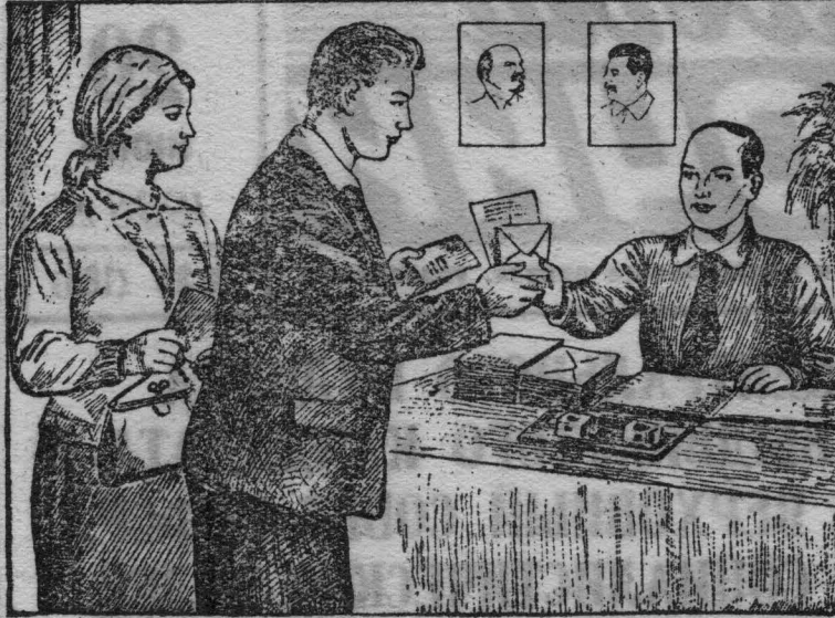
2. Этот документ избиратель предъявляет секретарю или члену участковой избирательной комиссии. После проверки по списку избирателей и отметки в списке избирателей, избиратель получает избирательный бюллетень и конверт установленного образца.