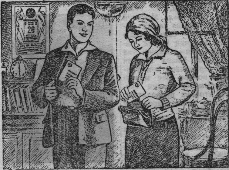
1. 26 июня, в день выборов в Верховный Совет РСФСР избиратель, отправляясь в любое время от 6 часов утра до 12 часов ночи в помещении своего избирательного участка для голосования, берет с собой либо паспорт, либо профсоюзный билет, либо колхозную книжку, либо иное удостоверение личности.