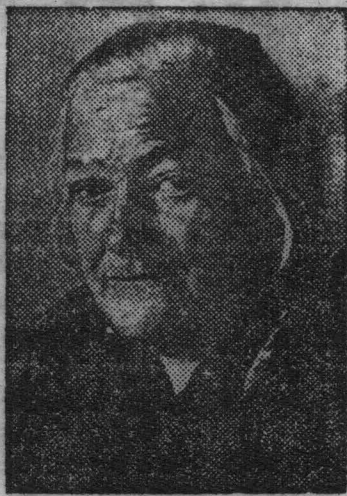
На снимке: Клара Цеткин

Клара Цеткин с огромным энтузиазмом встретила весть о Великой Октябрьской социалистической революции в СССР. На всю свою жизнь она осталась преданным, надеж-