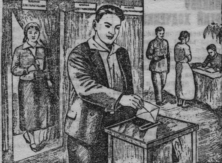
4. Избиратель переходит в комнату, где помещается участковая избирательная комиссия и отпускает конверт с избирательным бюллетенем в избирательный ящик.