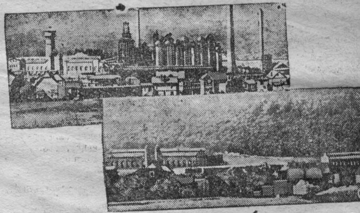
На снимке: (Верхнем) металлургический завод, принадлежавший сталеному тресту, в 1932 году завод разрушен (внизу).

При грандиозном росте промышленности в СССР, в капиталистических странах жестокий экономический кризис отбросил производство на 30—40 лет назад. В Германии например, омертвление аппарата тяжелой индустрии составляет 65 проц. Особенно ярко разительное действие кризиса проявилось в Рурской области. В геранде (Рур) из 42 железных, динковых и медных рудников работют только 6; из 31 доменной печи — 4; из 17 прокатных заводов — 3; 16 мартеновских печей — 4; остановившиеся предприятия вообще, существуют на их месте остались только руины.