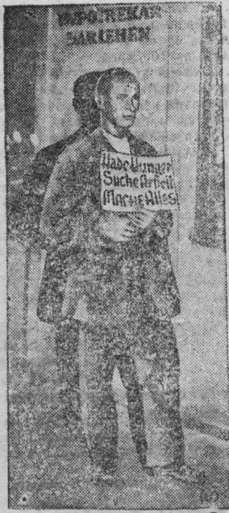
На снимке: На улицах Вены безработный держит перед собой объявление: „Голодаю ищу работу“.

В Берлине, Нью-Йорке, Риме, Лондоне во всех городах капиталистических стран стоят на улицах истощенные люди, держа перед собой объявления: „Голодаю“, „Ищу работу“, „Согласен на любые условия“... и т. д. и т. п.