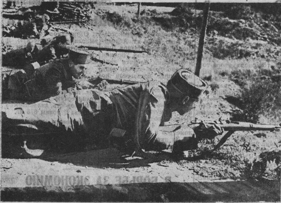
На снимке: Упражнения курсантов по стрельбе.