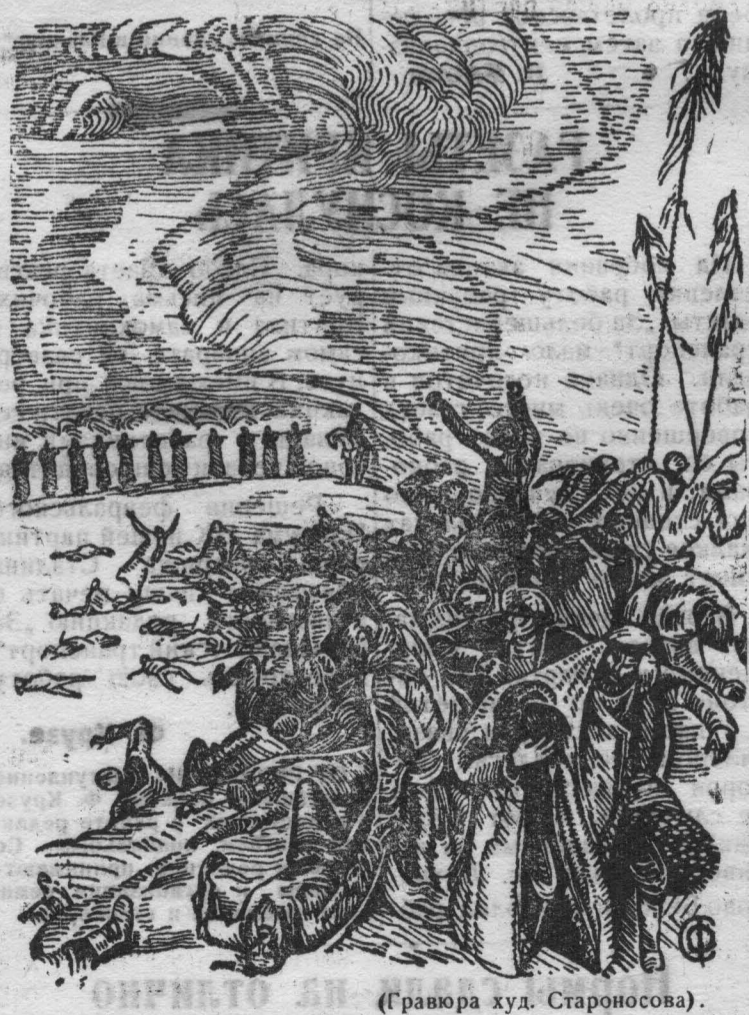
(Гравюра худ. Староносова.)