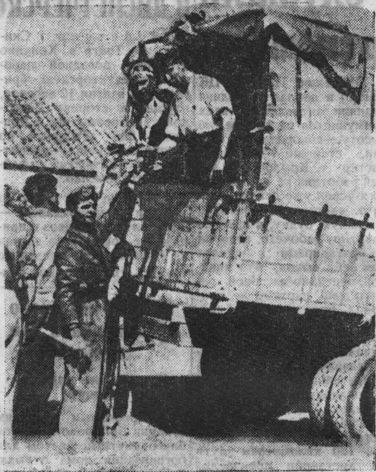
Походный буфет, обслуживающий бойцов правительственных войск на мадридском фронте. (Союзфото).