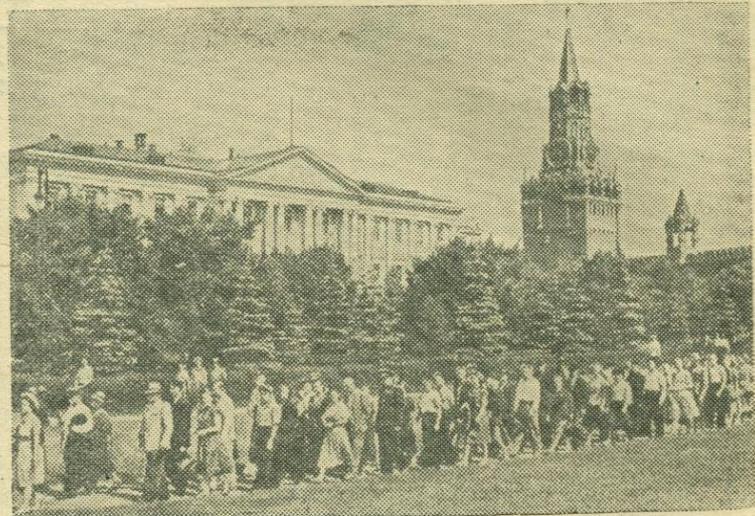
Московский Кремль открыт для свободного посещения трудящихся.