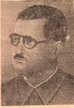
Бертольд Брехт (Германия)