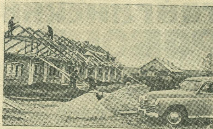
Алтайский край. В колхозе «Память Ленина» Марушинского района работает несколько строительных бригад. За два года они построили коровник на 100 голов, здание электростанции, гараж, мастерские, кузницу, два зернохранилища, птичник. По перспективному плану колхоза в течение пятилетия намечено соорудить 50 производственных и культурно-бытовых помещений и 50 жилых домов.

Л. РЕЗОВА, зав. отделом пропаганды и агитации ГК ВЛКСМ.