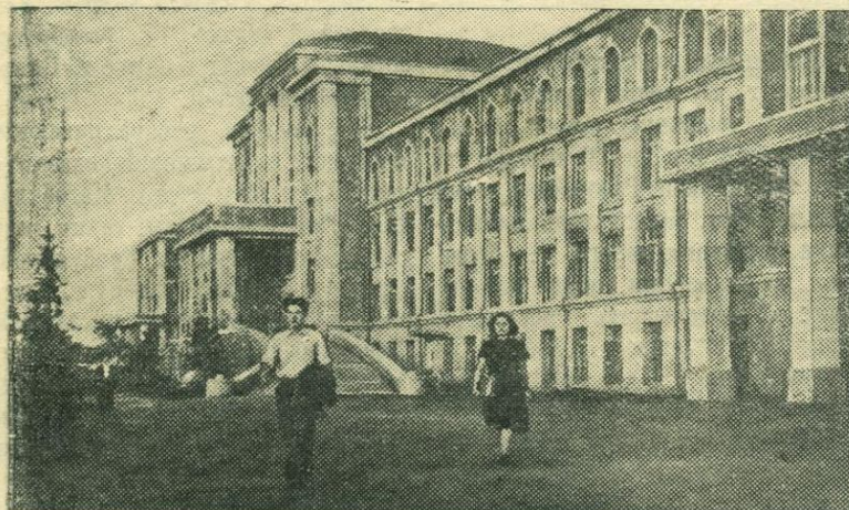
Корейская Народно-Демократическая Республика. Университет имени Ким Ир Сена в Пхеньяне.

Число специалистов в угольной промышленности выросло в 3,5 раза по сравнению с 1953 годом. В первом полугодии 1955 года добыча угля возросла в 6 раз по сравнению с тем же периодом 1953 года. (ТАСС).