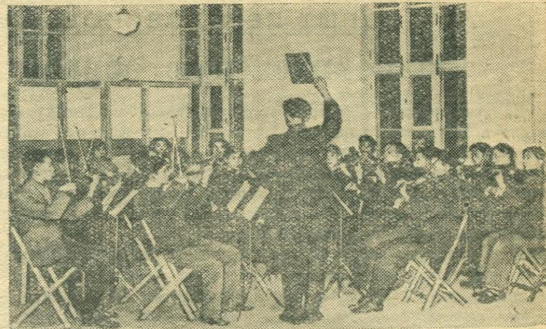
Китайская Народная Республика. В прошлом году на Аньшаньском металлургическом комбинате построен новый клуб. Он стал сейчас центром культурно-массовой работы среди рабочих и служащих предприятия.

На снимке: симфонический оркестр рабочих и служащих Аньшаньского комбината готовится к концерту.