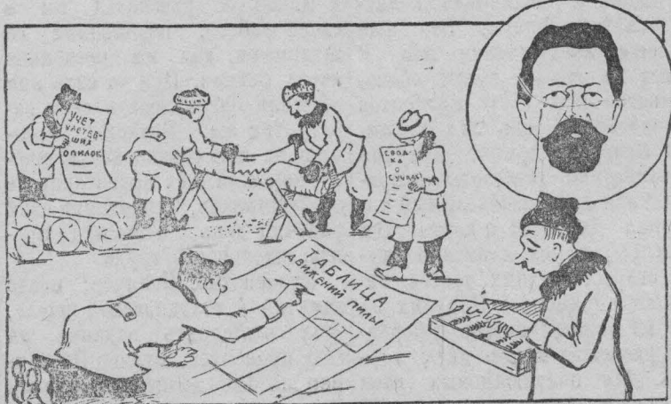
Чехов: Оказывается, еще не везде перевелись «лишние люди».

В артели «Волна революции» раздуты штаты управленческого аппарата. Под разными предлогами здесь вводятся новые единицы. Лишней единицей в артели является старший бухгалтер. (Из корреспонденции).