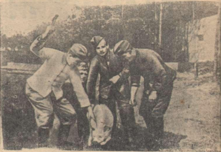
МАРОДЕРСТВО ФАШИСТСКИХ БАНДИТОВ. На территории советских районов, временно занятых немцами, идет безудержный грабеж. Немецко-фашистские солдаты забирают у жителей сел и местечек все ценное, режут скот, грабят магазины. Фашистское командование всячески поощряет мародерство и грабеж, поддерживая этим «моральное состояние» своих войск. На этом снимке, найденном у убитого громилы, изображена компания фашистских мародеров, забивающая свинью, отнятую у колхозников. Свою «доблесть» они постарались увековечить снимком.