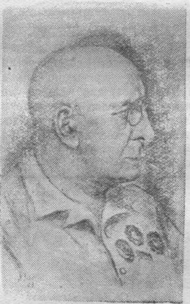
Знаменитый русский ученый Василий Робертович Вильямс.