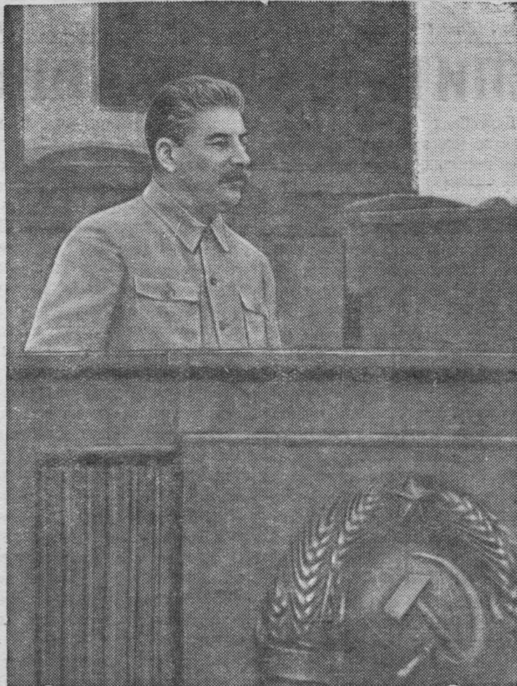
Выступление товарища И. В. Сталина на торжественном собрании, посвященном выпуску командиров, окончивших военные академии, состоявшемся в Большом Кремлевском Дворце 5 мая 1941 г.

Всего будут сдавать экзамен 490 учащихся, из них 300 забойщиков.