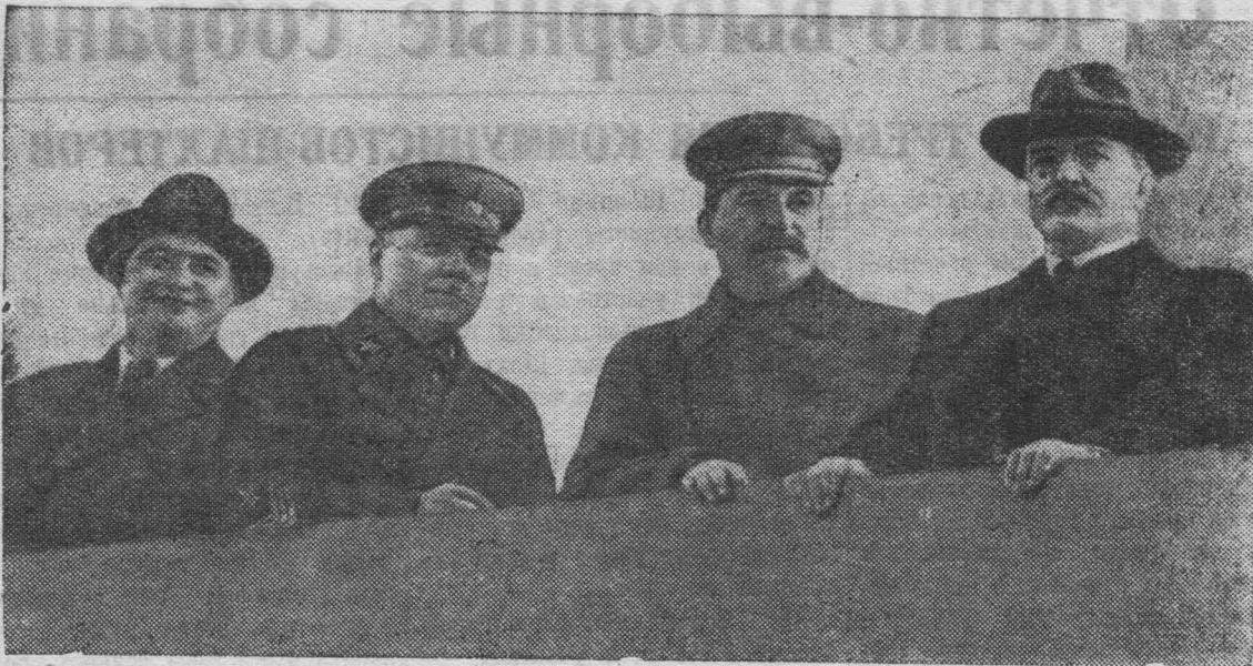
На снимке (справа налево): товарищи В. М. Молотов, И. В. Сталин, К. Е. Ворошилов и Г. М. Димитров на трибуне мавзолея

чрезвычайного и полномочного посла, чрезвычайного и полномочного посланника, поверенного в делах. (ТАСС).