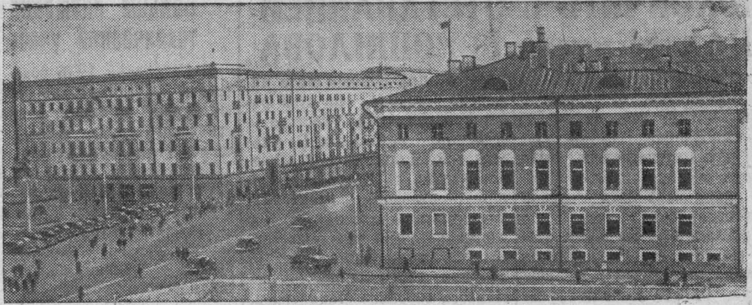
Вид на улицу Горького и угол Советской площади. Справа—передвинутое здание Московского Совета. Слева—новые дома.