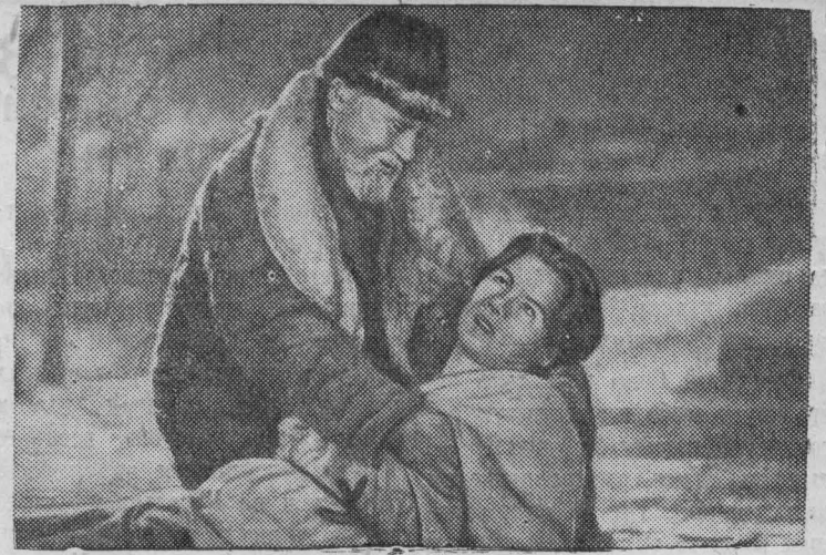
Кадр из фильма «Мои университеты» (заклительная часть кино-трилогии о молодом Горьком). Сторож татарин поднимает раненого Алексея Пешкова (артист Н. Вальберт). В роли сторожа артист-орденоносец Л. Свердлин.

Со стороны Союза ССР протокол подписал Председатель Совнаркома СССР и Народный Комиссар Иностранных Дел тов. Молотов В. М. и со стороны Финляндии чрезвычайный посланник и полномочный министр г-н Ю. Паасикиви.