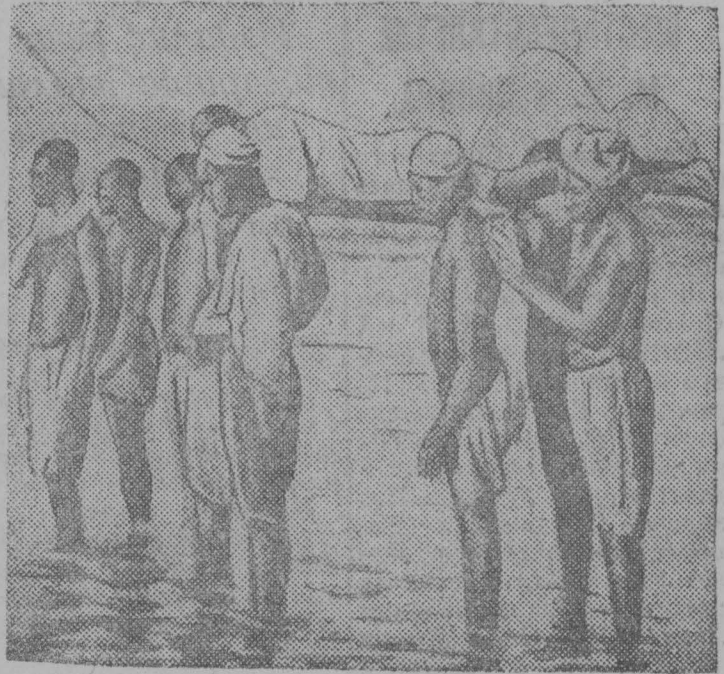
Абиссинские солдаты на северном фронте уносят раненого с линии огня