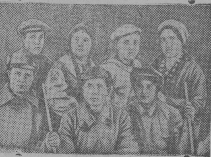
Драмкружок шахты им. Сталина.

зовать базар при ст. Усяты. До сих пор базар не организован. В наказе избиратели отметили: организовать автобусную линию к шахте Черная гора, и автобус до сих пор в этом направлении не ходит.