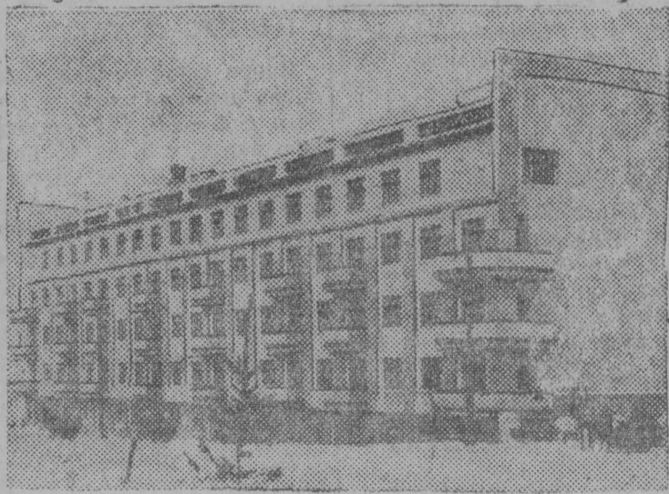
Заканчиваемый строительством дом специалистов в Прокопьевске

22 ноября в Народном комиссариате по иностранным делам народный комиссар М. М. Литвинов и посол США в СССР господин В. Буллит обменялись нотами об исполнении судебных поручений. Этими нотами установлен порядок исполнения судебных поручений советскими судами по просьбе американских судов и соответственным американскими судами по просьбе советских судов. (ТАСС).