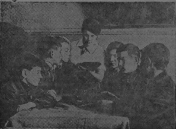
Пионеры отряда при клубе им. Артема изучают фотоаппарат

На том бугре, где громоздился белая церковь и дома кулаков-эксплуататоров, сегодня