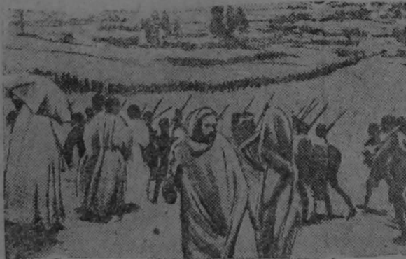
Абиссинские войска в походном марше из Харара в провинцию Огаден.

Выступивший от имени радикалов Дельбос поддержал предложение Тореза и внес дополнительное предложение об организации цетвиза по всей стране с требованием роспуска фашистских организаций.