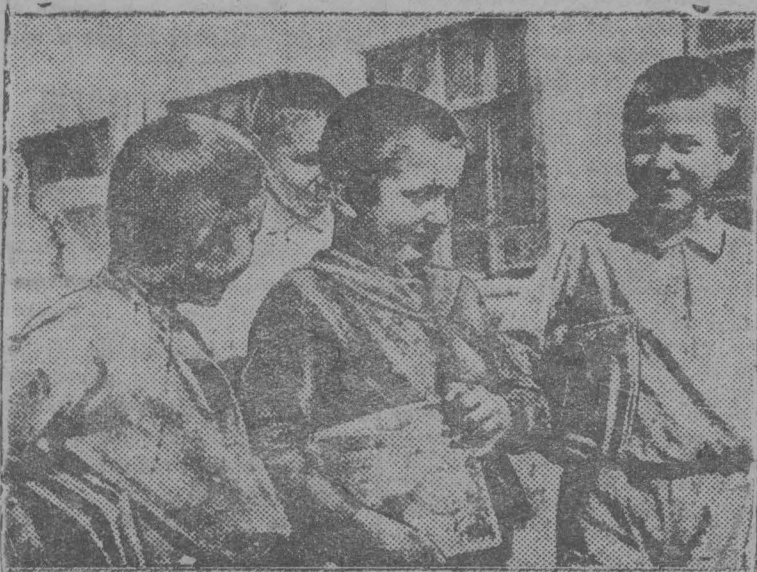
УЧЕНИКИ ИДУТ С ЗАНЯТИЙ.

В детском приемнике проводится внешкольная работа, при которой детям санитарно-гигиенические, трудовые навыки и дисциплина. Воспитатели проводят с детьми чтение литературы, физкультурные игры. Организован музыкальный кружок.