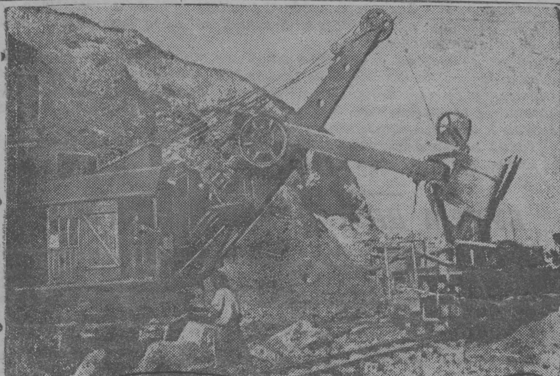
НА СНИМКЕ: Экскаватор за работой — нагружает породу для забойки.