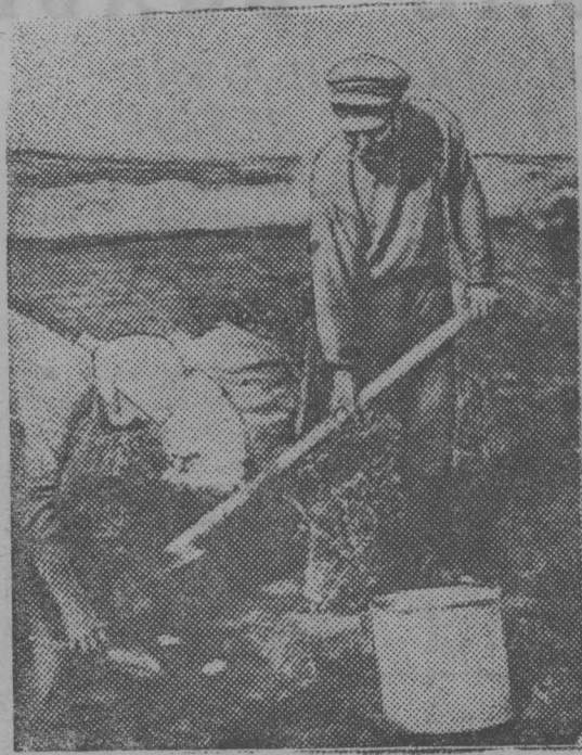
В Прокопьевске началась массовая уборка урожая на индивидуальных рабочих огородах...