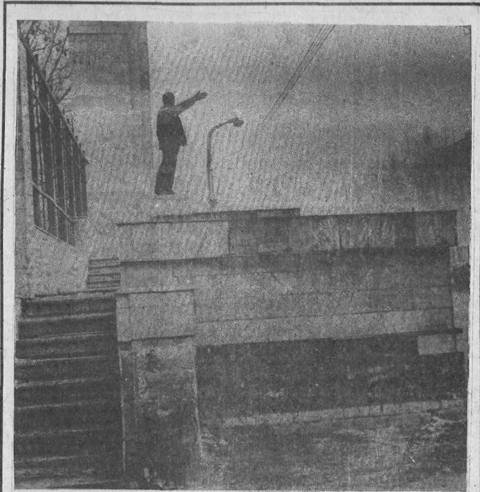
Фоторассказ Н. Бабарицкого «Как встречаем этот день» читайте на 2-й стр.