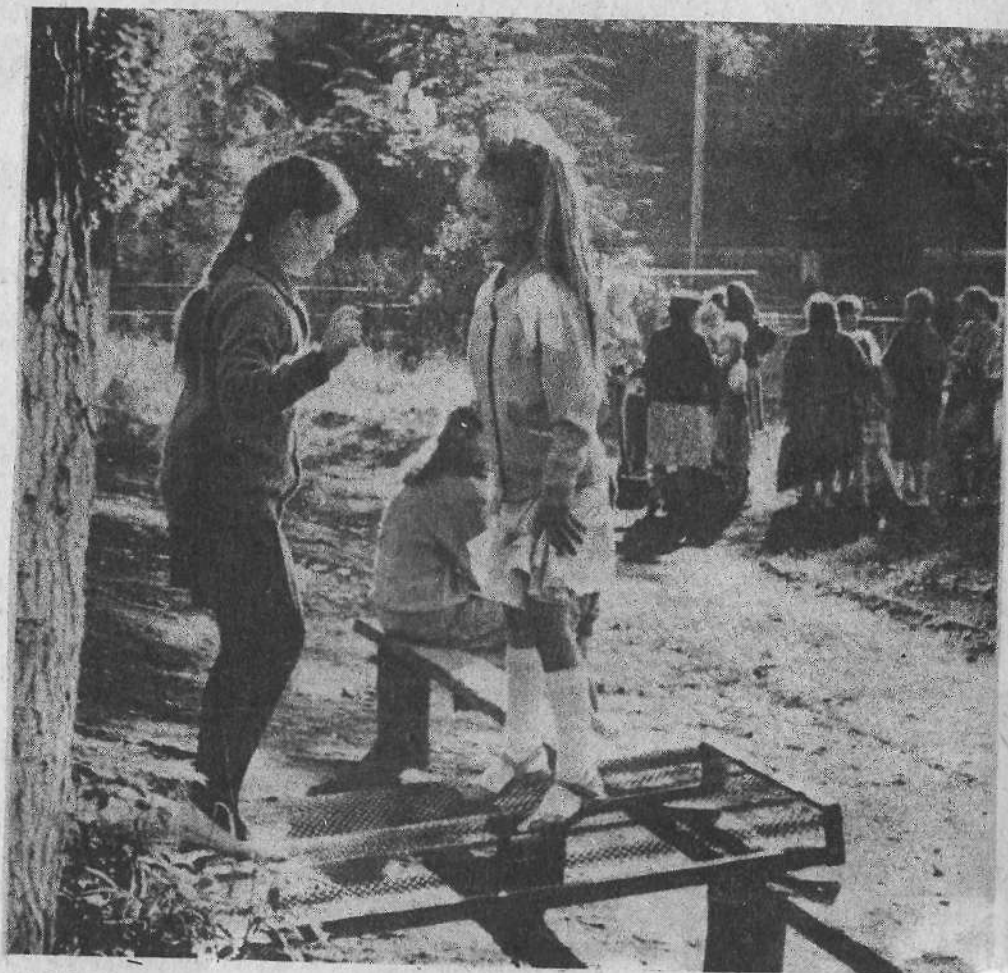
ВОТ И ЛЕТО ПРОШЛО.