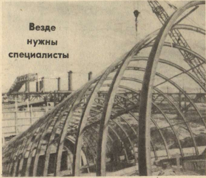
Везде нужны специалисты

объявляет прием учащихся по специальностям: дневное отделение (на базе 8 классов): подземная разработка угольных месторождений, эксплуатация и ремонт горного электромеханического оборудования и автоматических устройств, маркшейдерское дело, техническое обслуживание и ремонт автомобилей, строительство горных предприятий; заочное отделение (10 классов): подземная разработка угольных месторождений, эксплуатация и ремонт горного электромеханического оборудования и автоматических устройств, техническое обслуживание и ремонт автомобилей. Заявления принимаются с 3 мая по 1 августа, на специальность техобслуживание и ремонт автомобилей — до 10 августа. Техникум проводит эксперимент по приему без вступительных экзаменов по конкурсу свидетельств и аттестатов на все специальности, кроме техобслуживания и ремонта автомобилей. На данную специальность сдаются экзамены по русскому (письменно) и математике (устно). Для поступления необходимы заявление на имя директора, характеристика, медицинская справка формы № 086/у, четыре фотографии (3x4 см); документ об образовании, копия трудовой книжки, заверенная начальником отдела кадров или руководителем предприятия. При себе иметь паспорт (свидетельство о рождении), военный билет. Учащимся дневного отделения выплачивается стипендия 37 рублей. Приемная комиссия работает с 3 мая с 8 до 17 часов в аудитории № 31 (кроме субботы и воскресенья). Телефон для справок 3-63-32. Адрес: ул. Шишкина, 30.