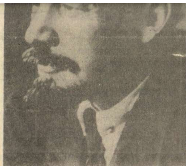
22 апреля — день рождения В. И. Ленина