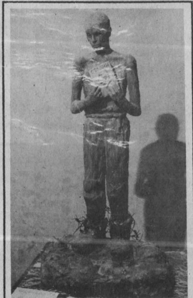
НА СНИМКЕ: ОДИН ИЗ ПРОЕКТОВ ПАМЯТНИКА ЖЕРТВАМ СТАЛИНСКИХ РЕПРЕССИЙ.

— якобы разрушенное хозяйство страны необходимо было восстановить как можно скорее. Но ведь не зря же народная мудрость гласит: на несчастье счастья не построишь. Как можно говорить о великой цели — построении самого справедливого общества, если для достижения ее используются человеконенавистнические средства: рабский труд (иначе нельзя