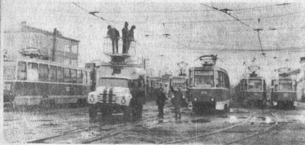
● Рабочий день в депо.