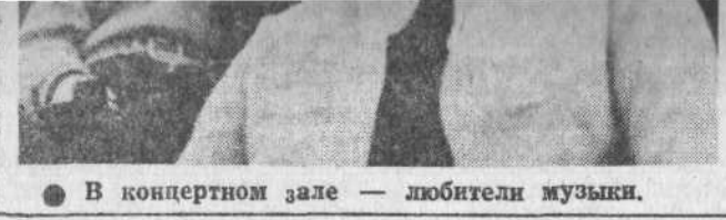
● В концертном зале — любители музыки.

Клуб шахты «Северный Маганак» Воскресенье. 20 часов — лекция «Вред религии на воспитание подрастающего поколения».